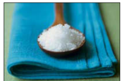
102 ΠΟΥ ΚΡΥΒΕΤΑΙ ΤΟ ΑΛΑΤΙ;