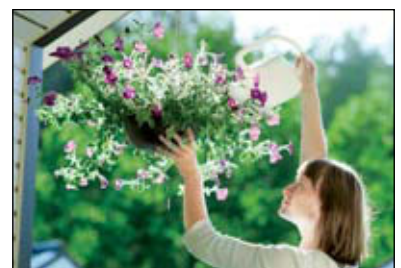
154 ΛΙΓΟ ΠΡΑΣΙΝΟ, ΠΑΡΑΚΑΛΩ