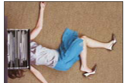
66 ΣΥΝΔΡΟΜΟ ΕΠΑΓΓΕΛΜΑΤΙΚΗΣ ΕΞΟΥΘΕΝΩΣΗΣ