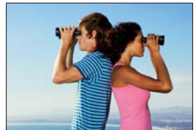
96 ΤΕΣΤ: ΤΙ ΕΠΙΦΥΛΑΣΣΕΙ ΤΟ ΜΕΛΛΟΝ;