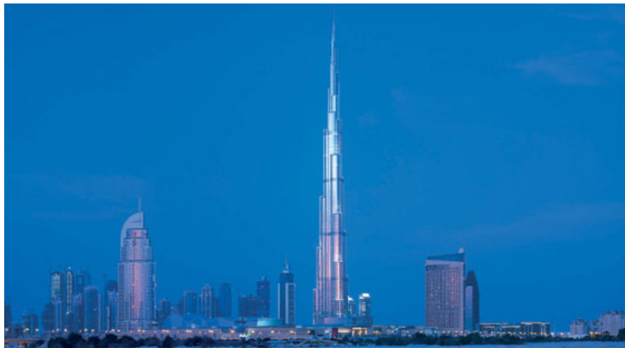
Ο ουρανός δεν είναι το όριο Το ύψους 828 μ. Burj Khalifa στο Ντουμπάι είναι το υψηλότερο τεχνητό οικοδόμημα του πλανήτη και φέρει την υπογραφή του αρχιτέκτονα Εϊντριεν Σμιθ.