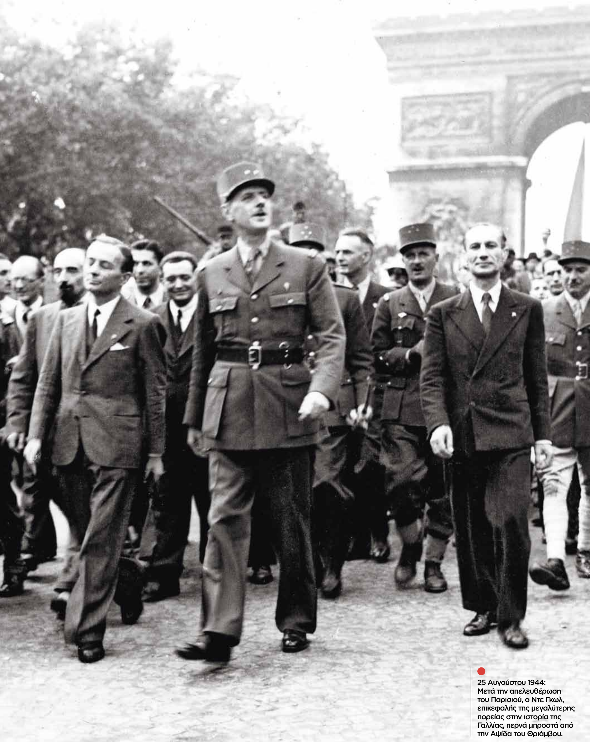
● 25 Αυγούστου 1944: Μετά την απελευθέρωση του Παρισιού, ο Ντε Γκωλ, επικεφαλής της μεγαλύτερης πορείας στην ιστορία της Γαλλίας, περνά μπροστά από την Αψίδα του Θριάμβου.