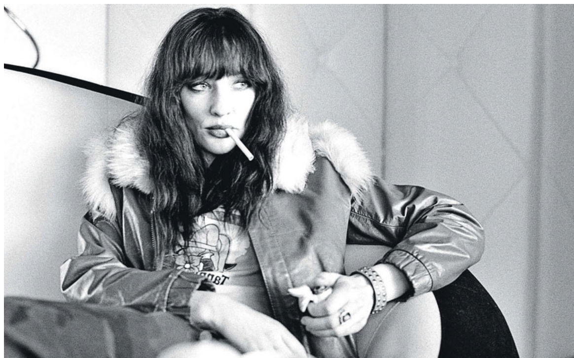
● Η Κέιτ Μπλάνσετ σε σκηνή από την ταινία του Τζιμ Τζάρμους «Καφές και τσιγάρα» (2004).

Ταλαντούχα ηθοποιός, μαχητική ακτιβίστρια και αφοσιωμένη μητέρα, η 49χρονη Αυστραλή δεν μασάει ποτέ τα λόγια της και – άθελά της ή όχι – συνήθως ταραίζει τα νερά.