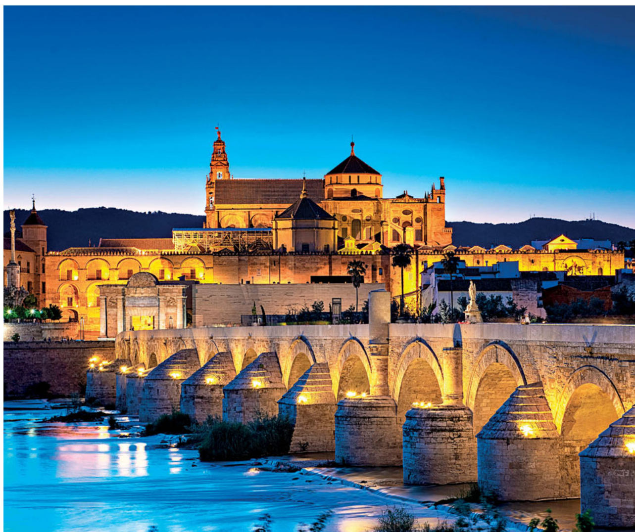
● Ο ποταμός Γουαδαλκιβίρ, η ρωμαϊκή γέφυρα και η κατάφωτη Μεσκίτα: μια υπερπαραγωγή στο ιστορικό κέντρο της πόλης.

850 κολόνες, χτισμένες σε διαφορετικούς αρχιτεκτονικούς ρυθμούς, πάνω στις οποίες ακουμπούν αφίδες σε λευκό και κόκκινο χρώμα. Στο κέντρο δεσπόζει ο λαμπρός καθεδρικός ναός, κατασκευασμένος σε μπαρόκ ρυθμό. Γύρω από τη Μεσκίτα, η Χουδερία, η παλιά εβραϊκή συνοικία με τα στενά δρομάκια, είναι ένας λαβύρινθος που αξίζει να εξερευνησετε, μαζί με όλο το ιστορικό κέντρο της πόλης το οποίο περιλαμβάνεται από το 1984 στη λίστα των Μνημείων Παγκόσμιας Πολιτιστικής Κληρονομιάς της UNESCO. Τα ανθοστολισμένα στενά μοιάζουν ψεύτικα – το πιο διάσημο είναι «το δρομάκι των λουλουδιών» με τις κρεμασμένες στους τοίχους του γλάστρες. Οι μεγάλες αυλές με τα χρωματιστά πλακάκια και τα μικρά σιντριβάνια μπροστά από τις εισόδους των σπιτιών είναι πανέμορφα. Η Συναγωγή αποτελεί έτερο σημαντικό αξιοθέατο. Στο Palacio Episcopal, κτίσμα του 16ου αιώνα, στεγάζεται το Μουσείο Καλών Τεχνών. Το ανάκτορο Αλκάθαρ ήταν αρχικά φρούριο όπου ζούσαν καλόγεροι. Οι ανθισμένοι κήποι του με τα νερά και τα σιντριβάνια είναι όαση δροσιάς στο κέντρο της πόλης. Το Φρούριο Καλαόρα βρίσκεται στην απέναντι πλευρά της ρωμαϊκής γέφυρας. Ενδιαφέρουσα η συλλογή του Αρχαιολογικού Μουσείου, ενώ στο πρώην «Μουσείο Βασανι-